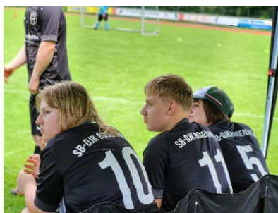
Bericht/Fotos: Max Haubensack