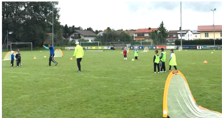
DJK-Zwischenpuls – 2-2017