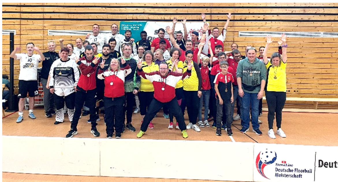
Alle Teilnehmer beim gemeinsamen Abschlussfoto