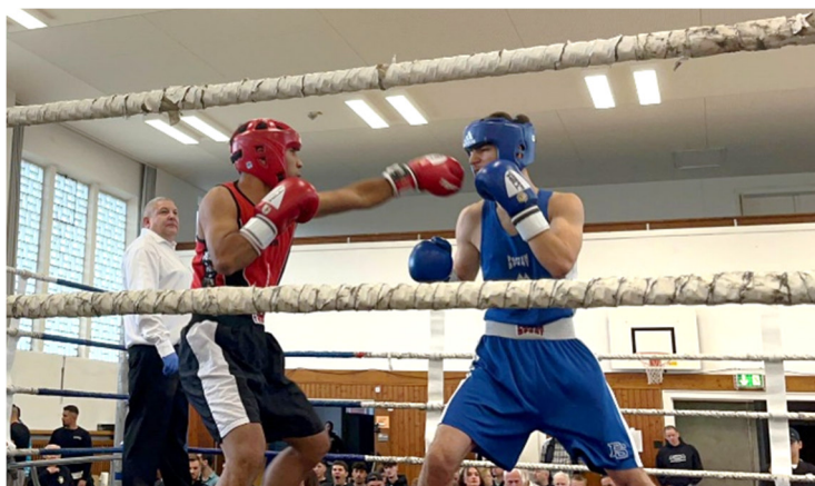
"Finte" nach innen, die Führungshand des Gegners wird abgewehrt;