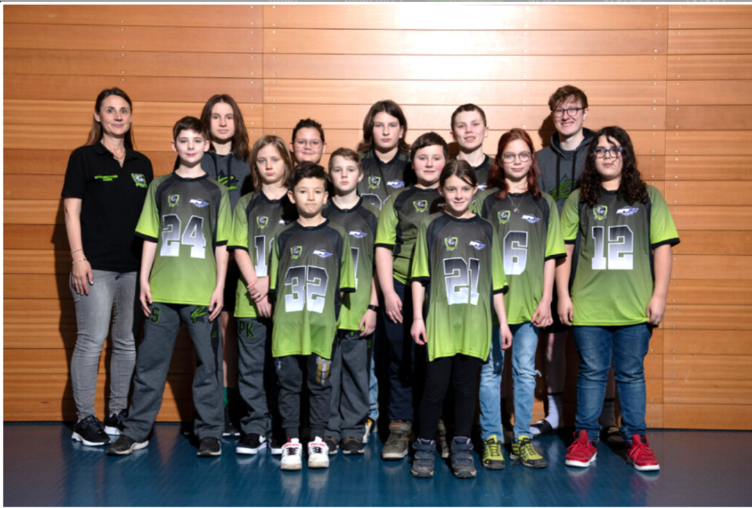
Flag-Football Abteilung der ROSENHEIM REBELS (DJK Sportbund Rosenheim)

Bemerkenswert ist, dass einer dieser Vereine auch eine Abteilung der DJK ist: Die Rosenheim Rebels gehören zum DJK Sportbund Rosenheim.