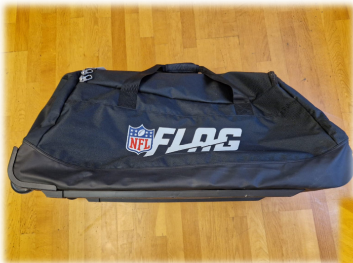
NFL FLAG Tasche (mit Bällen, Flaggen, Hütchen, Leibchen und Ordner mit Spielzügen)

Im Rahmen dieser Fortbildung wurde dem DJK-Sportverband München und Freising von der NFL Germany (Düsseldorf) eine Flag-Football Tasche zum dauerhaften Verbleib übergeben: